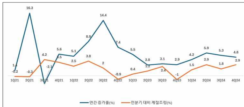
<그림 1> 말레이시아 GDP 성장률 (2018년 3분기~2024년 4분기)

*2024년 4분기 전분기 대비 계절조정 성장률은 추정치. 출처: Department of Statistics Malaysia 2025년 1월 17일