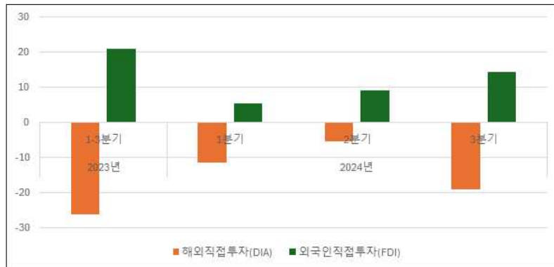
<그림 3> 말레이시아 해외직접투자 및 외국인직접투자(단위: 십억 링깃)

* IMF의 BPM5 분류 기준에 따른 분류. 음수(-)는 자금 유출, 양수는 자금 유입을 의미